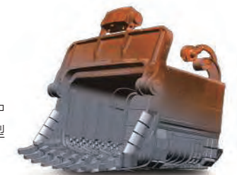
在 Geomagic Design X 中創建的參數化實體模型

如果您能夠在 CAD 中進行設計，您便可以立即使用 Geomagic Design 進行工作。簡潔美觀的使用者介面和工作流程工具使其易用性更勝從前，供您快速精確地創建已設計和已構建的 3D CAD 和模型資料。